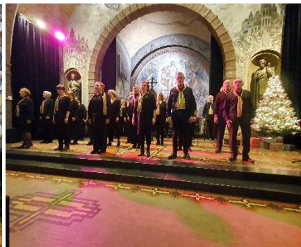
Figuur 6 Popkoor Vocal Sound