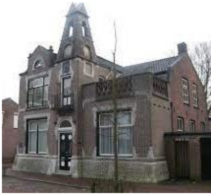
Figuur 3. 't Oude Raadhuis in Gilze

Wat betreft digitalisering zijn zij een van de voorlopers. Vanaf het begin zijn zij betrokken geweest bij de ontwikkeling van Memorix Maior als collectieregistratiesysteem voor erfgoedinstellingen. Foto's en bidprentjes zijn digitaal te raadplegen via de site van Heemkring Molenheide op de Beeld- en Archiefbank. De bidprentjes zijn niet alleen geregistreerd maar ook gescand en als afbeelding te bekijken. De website wordt gehost bij ICT-bedrijf, Global-e, dat ook andere activiteiten ondersteunt. Na de inleiding was er een moment van pauze met koffie en thee waarna we door een aantal enthousiaste vrijwilligers werden rondgeleid door het museum en over het heemerf waar op dit moment de (heem)tuin helemaal opnieuw wordt opgezet. Hoewel we verder niet zoveel van het dorp Gilze hebben gezien was het bezoek aan 't Oude Raadhuis een geslaagde invulling van "gluren bij de burens".