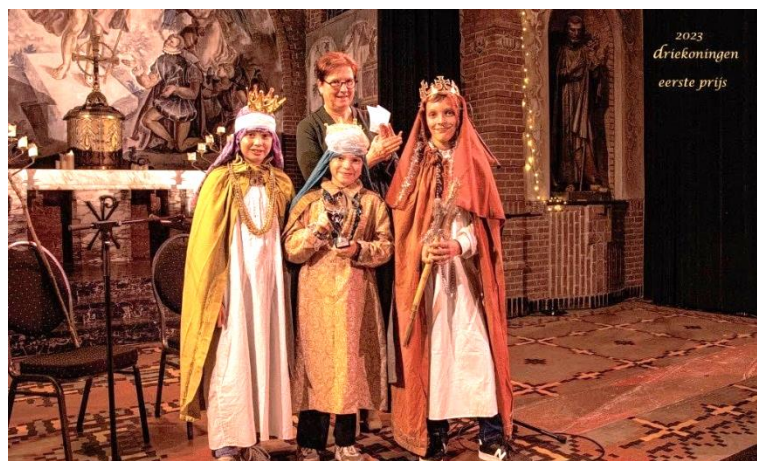
Figuur 1 Driekoningenzingen 2023, eerste prijs, groep De Regenboog