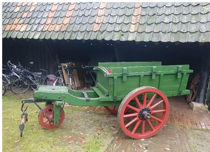
Figuur 8 De driewielige stortkar in oude glorie hersteld

De groep heeft dit jaar de driewielige stortkar uitvoerig gereviseerd. De kar stond buiten maar krijgt nu een plek in een van de karloods.