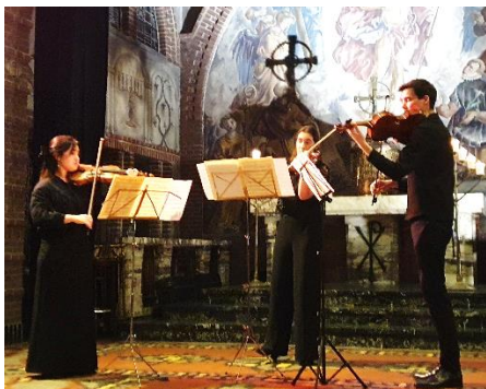
Figuur 5, Trio Euregio jeugdorkest

Het muzikale stokje werd overgenomen door popkoor Vocal Sound dat met 30 zangers de zaal vulde met Nederlandse, Franse en Engelse kerstliederen, afgewisseld met andere sfeervolle liederen. Na de pauze bracht het popkoor nog een vervolgprogramma en door hun wijze van presenteren met beweging en expressie was het niet alleen een aangenaam luister- maar ook een aangenaam kijk-schouwspel.