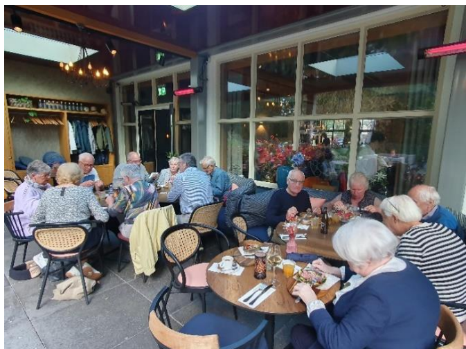
Figuur 2. Lunch in restaurant De Huyskamer