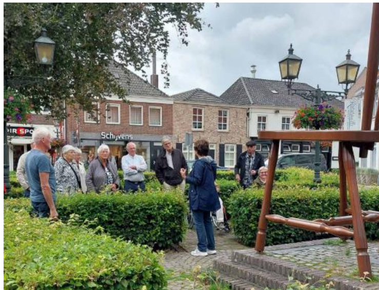
Figuur 4. De stoel, icoon Oirschotse meubelindustrie

Gastheer (voor de 4 e keer) op deze Brabantse heemdagen was heemkundekring 'De Heerlijkheid Oirschot', die zich al meer dan 70 jaar met passie bezig houdt met de geschiedenis van Oirschot en al dit moois graag wil delen.