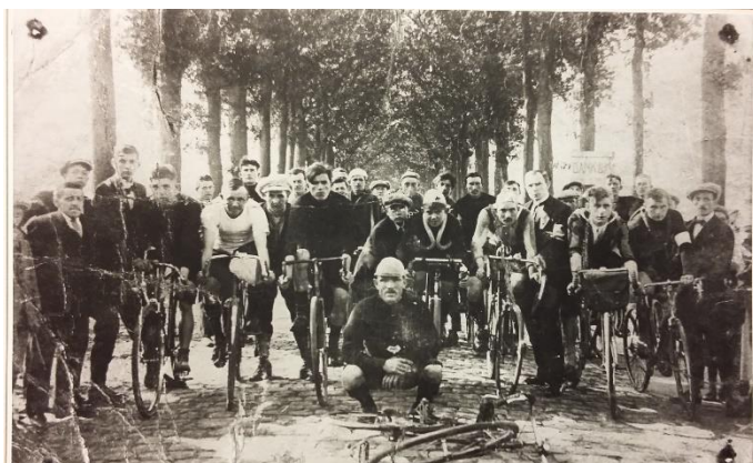
Figuur 1 Steeds Sneller was de 1e wielclub in Goirle in 1922

Wegens succes geprolongeerd! Vorig jaar volgden al ca. 40 Goirlenaren onze eerste cursus. Nu komt er een vervolg, met nieuwe onderwerpen welteverstaan. Een cursus op een gewoon prettig niveau. Geen vermoeiende diepgang, maar gewone kennis van alledag. Wist u bijvoorbeeld dat Goirle altijd zoveel verenigingen heeft gehad? En nog wel een Rooms Katholieke geitenfokvereniging en een gewone konijnenfokvereniging. Waarom dat verschil? Wij denken het te weten! En hoeveel sportverenigingen waren er wel niet in dit snelgroeïende dorp? En hoe maakten de Goirlenaren gebruik van vervoer en verkeer? Wij gaan het voor u uit de doeken doen! Kon je in Goirle ook naar school zonder fraters? Jawel, maar dan moest je wel een meisje zijn..! Waar komt de naam Oude Baan en Kleine akkers vandaan? Deze alledaagse geschiedenis over cultuur en natuur in Goirle gaan wij u presenteren in een vijftal lessen van 2 x 3 kwartier. Vooral geschikt voor de nieuwsgierige nieuwe Goirlenaren, maar ook voor de geïnteresseerde autochtone Goirlenaar is dit interessant!