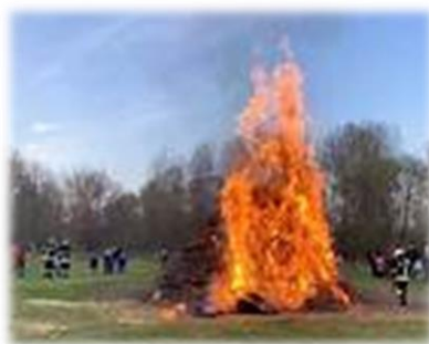
Paasvuur in Twenthe

Vrouwke, vrouwke doe oe best, Haol de eikes uit oewe nest, Van die witte hennen, God zal ze kennen. één ei is gin ei, 't twidde is 'n half ei, 't derde is 'n paosei. Van die wit en van die zwart, gif van elk henneke wat. Wat, wat Hennegat.