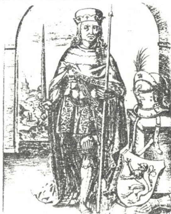
Hendrik I van Brabant