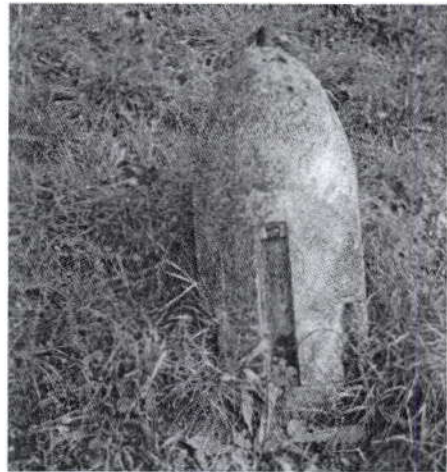
Foto van een cementbom

Het terrein lag bezaaid met cementbommen die na de oorlog door de boeren uit de omgeving werden gebruikt als “schampkei” bij de inrit naar hun boerderij. Aan de Ir. Van Meelweg in Westelbeers zijn nog diverse exemplaren te zien.