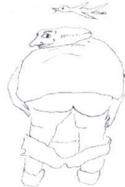
Oew eige broek ophaawe

Kèskenôoj is een verbastering van het franse woord "gasconnade", wat betekent "dikdoenerij".