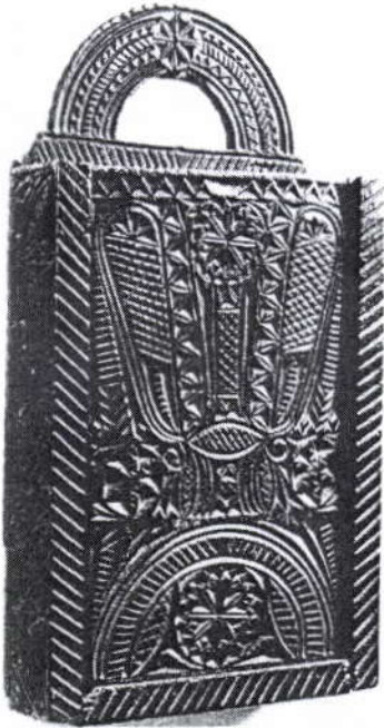
Houten schooltas, voor een kind het enige plekje om schoolspullen in op te bergen.

Op 7 juni 1795 gaat er een brief naar het nieuw gekozen gemeentebestuur, de "Municipaliteit" van Goirle. De brief is ondertekend door vele Goirlenaren, die verzoeken om verlost te worden van de onredelijke en voor de kinderen "gevaarlijke" schoolmeester Quirijn Rovers.