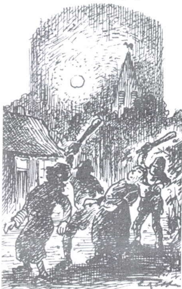
Een pak slaag in de Kerkstraat

Dat kon natuurlijk niet en het hele dorp werd dan ook een boete opgelegd. Alle mensen van het dorp moesten meebetalen. Ook meester Willem van Voorst.