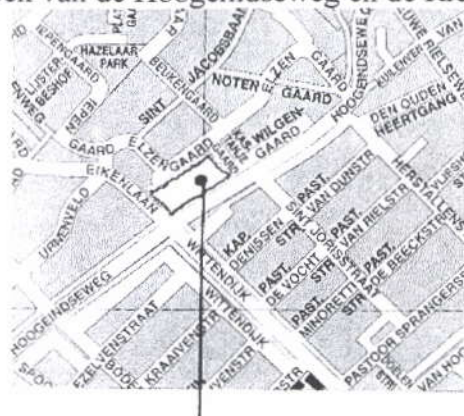
DE OPKAMER v.d. H. GEEST

In augustus 1964 werd in de parochie van St.-Jan een kapelaan benoemd met de opdracht de oprichting van een derde Goirlese parochie in Plan West voor te bereiden. Bij de stichting van een nieuwe parochie komt heel wat kijken: het verkrijgen van de nodige gelden, de keuze en aankoop van grond, het bouwen van een kerk en pastorie, de stichting van eigen parochiescholen en.....de aanleg van een begraafplaats. Iedere parochie had in die tijd immers een eigen kerkhof. De keuze viel op een hooggelegen akker op de hoek van de Hoogeindseweg en de Rielsedijk.