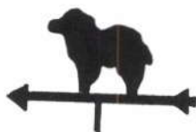
Nieuwe Rielseweg en op diverse andere plaatsen.