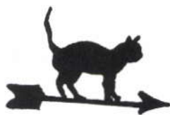
Van Hessen Kasselstr