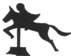
Abcovensedijk en Acacialaan