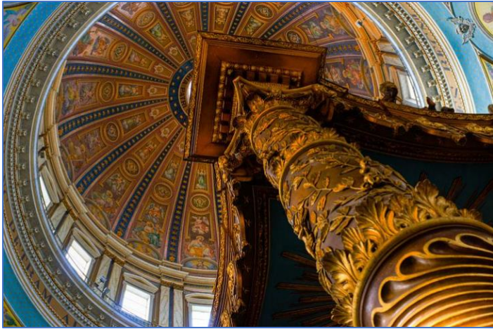
detail baldakijn hoofdaltaar

Het hoogste punt van de kerk is de koepel: 63 meter.