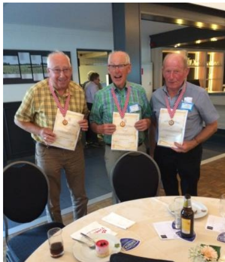
Figuur 4 Drie leden met oorkonde

Op 2 en 3 augustus waren de 70 ste Brabantse Heemdagen. Het is een jaarlijks terugkerend evenement voor vele heemmersen, ieder jaar in een of meerdere plaatsen in Brabant. Deze keer in Meierijstad (St. Oedenrode, Veghel, Zijtaart, Schijndel). Zulke heemdagen zijn een gigantische klus voor de organiserende heemkring(en) van dienst. Ze verdienen een grote pluim. Aan werkelijk alles moet worden gedacht: uitnodigingen, bewegwijzering, ontvangst, verkeersregelaars, huurfietsen, begeleiders, EHBO-ers, koffie, lunch, diner en dan hebben