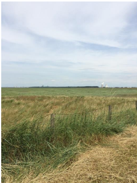
Figuur 3 Het Verdronken Land van Saeftinghe

Rond het middaguur werden onze groepen weer bijeen gevoegd en wij vertrokken met onze bus en de vrouwelijke gids voor een soort poldersafari richting het Verdronken Land van Saeftinghe. Wat wij mochten beleven tijdens deze rit overtrof onze stoutste verwachtingen; het schilderachtige landschap, de vlasvelden in bloei (ieder vlasplantje bloeit maar één dag!), de smalle landweggetjes en bovenal de Hedwige polder! Wij zijn waarschijnlijk de laatste heemkundekring, die hier met de bus, met een vrouwelijke gids en met een chauffeuse doorheen zijn gekomen. Na ons komt dit nooit meer voor!! De polder wordt onder water gezet. Was U hier niet bij? U kunt erover treuren, kans gemist. Wij werden er allemaal heel stil van i.i.g. en terecht. Hulde aan de gids en zeker ook aan onze chauffeuse.