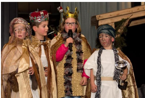
Figuur 1 Winnaars Driekoningen zingen

Op zaterdag 6 januari vond opnieuw de viering van Driekoningen in Goirle plaats, georganiseerd door de Heemkundekring De Vyer Heertganghen. Vanaf 15.30 uur speelde