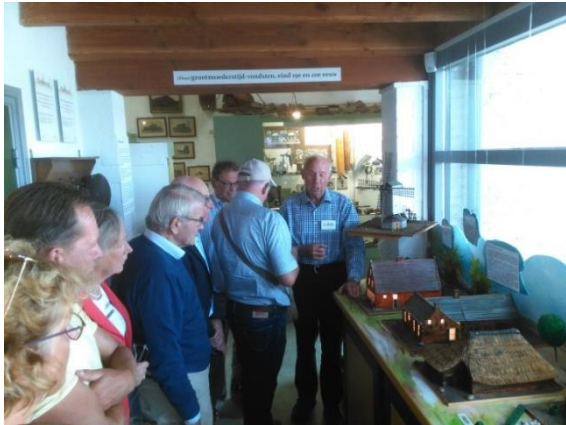
Figuur 5 rondleiding door het streekmuseum

Omstreeks 15.00 uur werden we verwacht in het vernieuwde Oudheidkundig Streekmuseum in Alphen. Op het grasveld onder de bomen stond koffie/thee klaar en daar was wel behoefte aan na het warme en droge bezoek aan de grafheuvel.