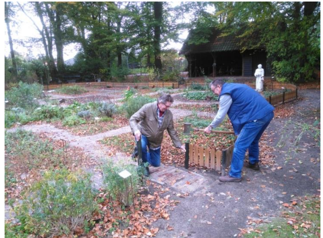
Figuur 6 Terugplaatsen van de tuinhekjes

Door de buxusmot zijn de heggen rond een aantal borders zodanig aangetast dat ze niet zijn weggehaald. In combinatie met de gevolgen van de droge zomer is het aanzien van de tuin wat minder dan we gewend waren.