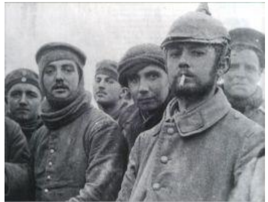
Figuur 1 Kerstbestand in Ploegsteert (België) in 1914