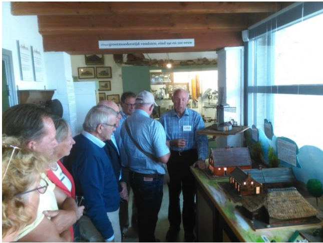
Figuur 5 rondleiding door het streekmuseum

Omstreeks 15.00 uur werden we verwacht in het vernieuwde Oudheidkundig Streekmuseum in Alphen.