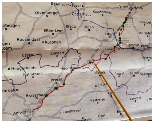
Figuur 3 De laatmiddeleeuwse weg Antwerpen - Den Bosch

Voor een aandachtig gehoor van ca 40 heemleden nam de heer Jan Sikkers de aanwezigen stapvoets mee op de weg zoals die vanaf ca 1400 tot ca 1800 liep vanuit Antwerpen naar Den Bosch.